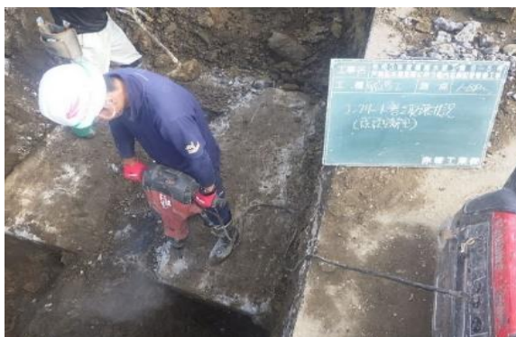
GL-4m 地点での地下水水替作業