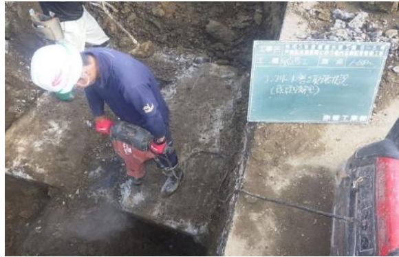
GL-4m 地点での地下水水替作業